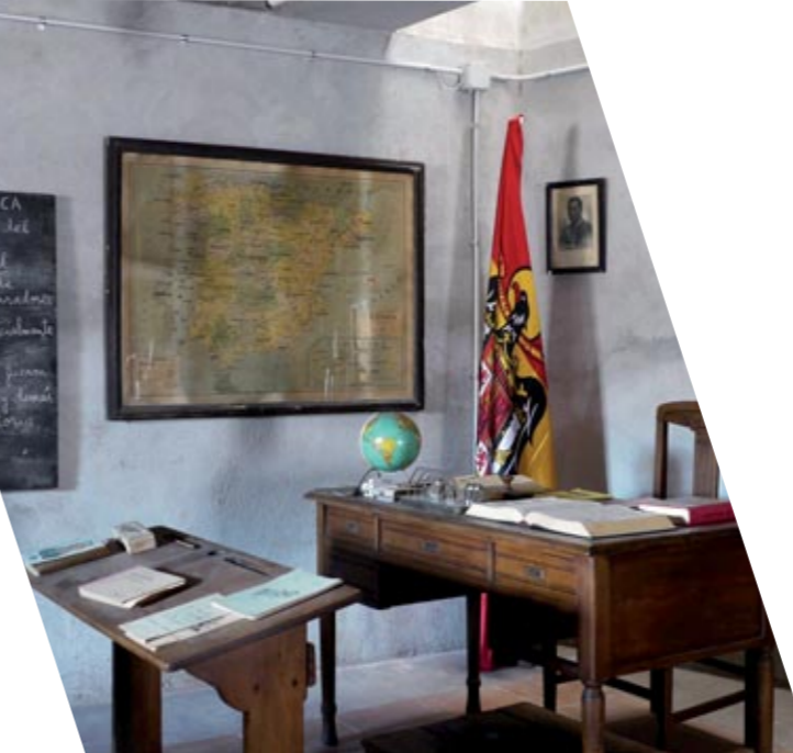
La escuela franquista / L'escola franquista

A la segona planta podem veure com era una tenda, una barberia o una escola durant la República i en el franquisme.