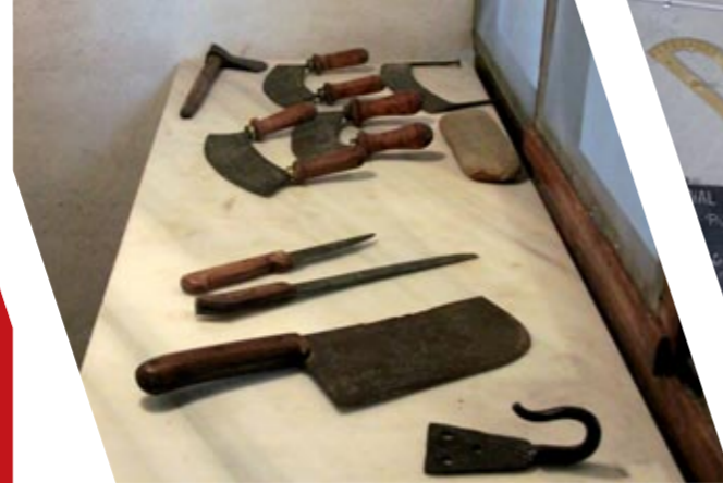
La carnicería / La carnisseria

El Museu Etnològic de Nonasp s'ha constituït gràcies a la tenacitat dels socis dels Amics de Nonasp, que han habilitat l'edifici i emprès successives ampliacions. També han restaurat les peces que s'hi exposen. Molts veïns de la vila hi han aportat la seua col·laboració.