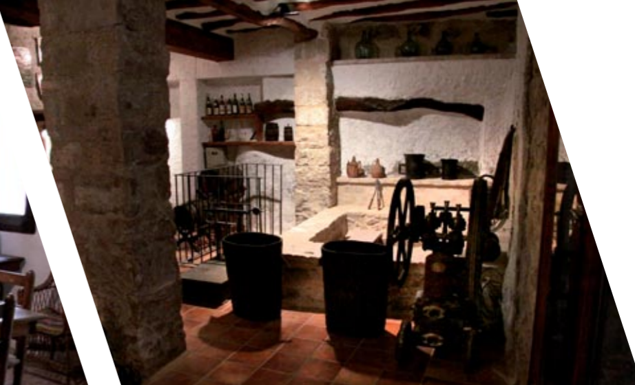
Elaboración del vino / Elaboració del vi

El Museo Etnológico de Nonasp es una instalación levantada gracias al empeño de los Amics de Nonasp, que han acondicionado el edificio y acometido sucesivas ampliaciones, además de restaurar las piezas que se exponen. Muchos vecinos de la localidad han aportado también su grano de arena.