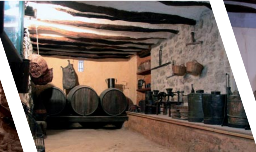
Bodega y útiles de la viña / Bodega i estris de la vinya.