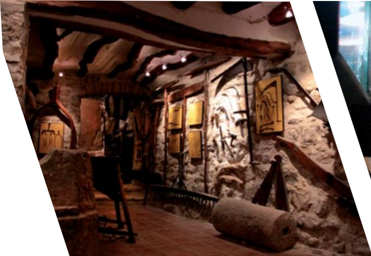
El cultivo de la tierra / El cultiu de la terra