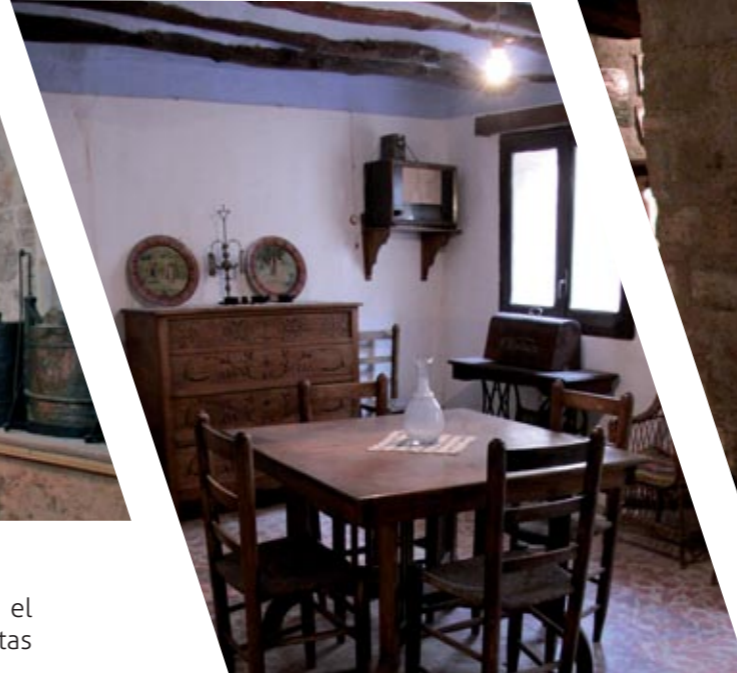
El comedor / Lo menjador