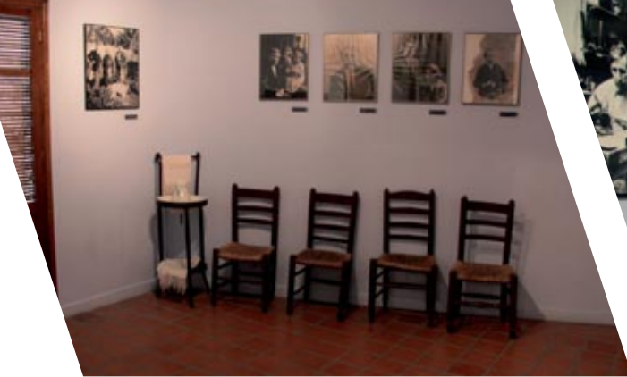
Sala de la casa con imágenes familiares del artista