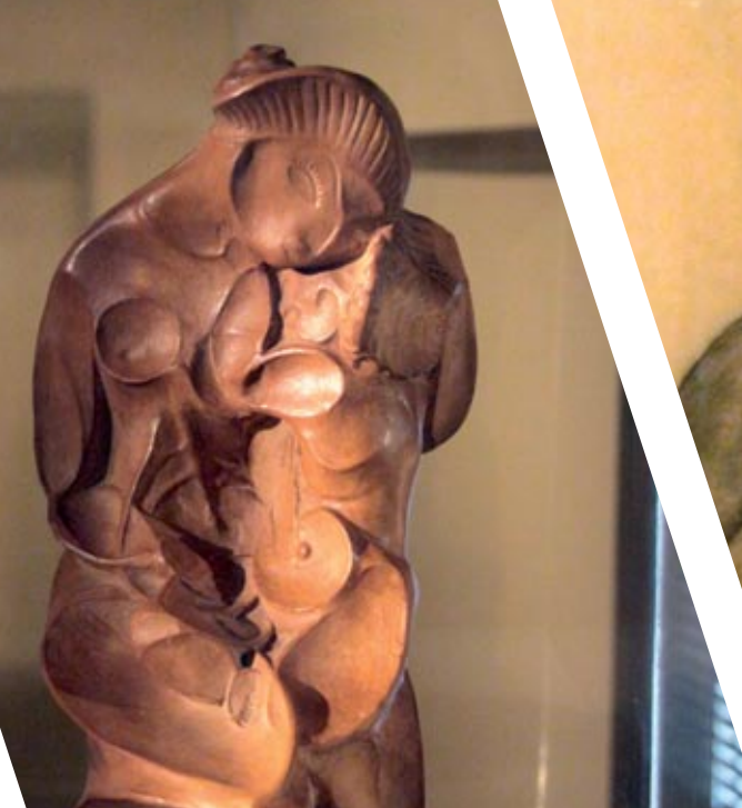
Maternidad , 1922

Se exponen también bocetos, como el original de Muchacho desnudo en la playa (obra de bronce expuesta en la avenida Pablo Gargallo) y documentación bibliográfica importante.