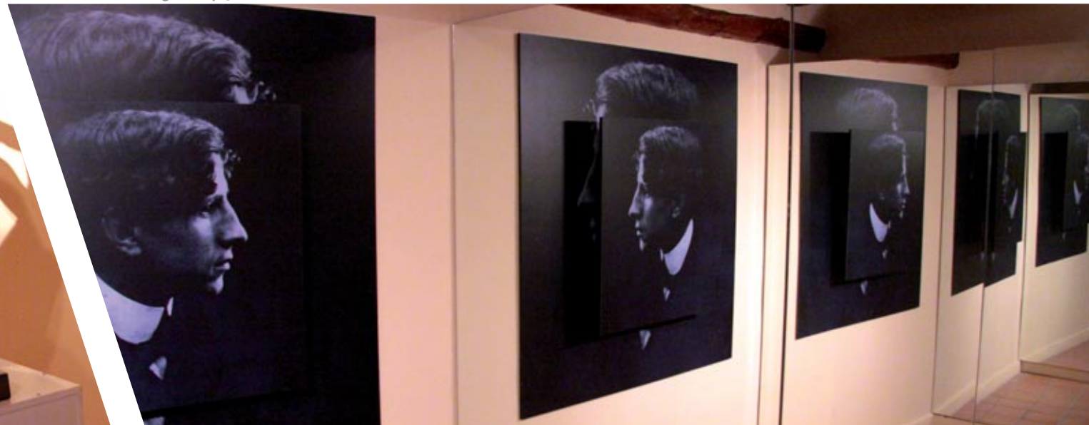
Juego de espejos en el audiovisual

Se exponen también bocetos, como el original de Muchacho desnudo en la playa (obra de bronce expuesta en la avenida Pablo Gargallo) y documentación bibliográfica importante.