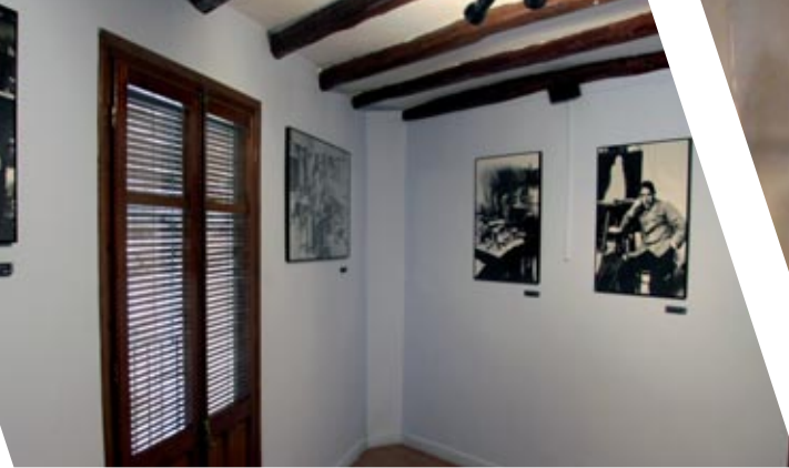
Estancia con fotos de Pablo Gargallo