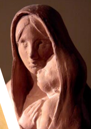
La Virgen (1894)