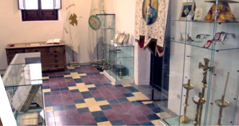
Vista del museo